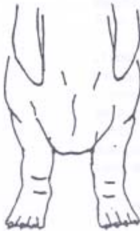
antérieurs demi-tors corrects