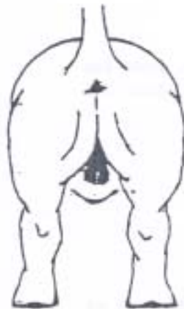
bon arrière-main cuisses gigotées